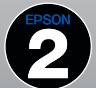
Garantía de dos años*